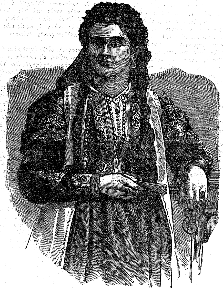
Η ΗΓΕΜΟΝΙΣ ΤΟΥ ΜΑΥΡΟΒΟΥΝΙΟΥ.

Τὰ εἶδη τὰ ἐξαγόρευα ἐκ τοῦ Μαυροβουνίου εἰσὶ