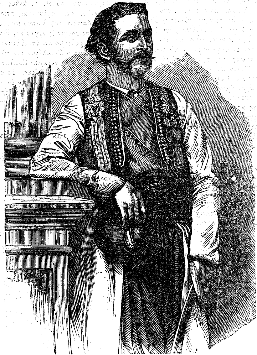
Ο ΗΓΕΜΩΝ ΤΟΥ ΜΑΥΡΟΒΟΥΝΙΟΥ.

Ἡ μακροβιότης τῶν Μαυροβουνιωτῶν εἶναι ἀξία παρατηρήσεως. Ὁ πάππος οἰκογενείας τινος διάγει τὸ 117 ἔτος, ὁ υἱός του τὸ 100, ὁ ἔγκονος τὸ 82, καὶ ὁ μέγας ἔγκονος τὸ 60 ἔτος· ὁ δὲ υἱός τοῦ τελευταίου